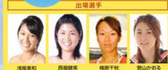
※写真、練習内容により参加選手が変更となる場合があります。